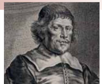
Foto: Casparus Barlaeus

Al tijdens haar leven werd Tesselschade Roemersdr. door dichtende tijdgenoten - allemaal mannen - naar voren geschoven als hun gelijkgestemde vriendin. Barlaeus wijdde in 1646 zelfs een aparte afdeling 'Tessalica' aan haar in zijn Latijnse Poemata. Ook als dichteres met een voorkeur voor spitsvondige formuleringen kreeg ze ruime bekendheid.