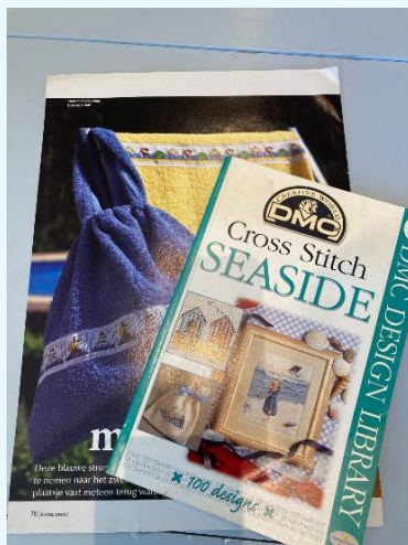
Laatste aanwinst/schenking aan bibliotheek

Studenten van de textielopleidingen komen geregeld in de Tesselschade bibliotheek op zoek naar oude technieken en patronen. Er is een kleine verzameling oude Tesselschade-Arbeid Adelt artikelen, die af en toe tentoongesteld worden. Wilt u langskomen om te zoeken in de boeken en tijdschriften?