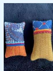
Quilts gemaakt van stoffen van de firma Stegeman.