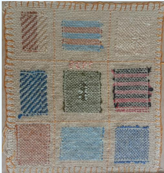
Stoplapje 1935-Leny Kroon 10 jaar oud.

De oudst bekende stoplap dateert uit 1694 maar waarschijnlijk zijn ook daarvoor al stoplappen gemaakt. Uit onderzoek is gebleken dat stoplappen zijn te herkennen aan typische kenmerken die gebruikt werden in bepaalde streken van het land. Het kleurgebruik is in de loop der tijd veranderd. Veel stoplappen hebben in het midden een geborduurd motief. Aan de hand van dat geborduurde motief is vaak te herleiden waar de stoplap is gemaakt. Half 19 de eeuw neemt het maken van traditionele stoplappen af. In diverse steden is een groot aantal stoplappen vervaardigd. Ik noem Amsterdam, Middelburg en Kampen. In Noord-Brabant zijn stoplappen teruggevonden met religieuze kenmerken. Soms werden de motieven van merk- en stoplappen gecombineerd. Er zijn diverse speciale steken om te stoppen. De eenvoudigste is de linnen- of platbinding, waarbij je een draad opneemt en een laat liggen. Bij de keperbinding neemt men een draad op en laat men er twee draden liggen. Bij de volgende toer verspringt een draad, waardoor een schuine lijn in het werk ontstaat. Verschillende mogelijkheden om te stoppen zijn, de kruisstop, de stop voor een winkelhaak, de hoekstop, de randstop, de doorstop enzovoort.