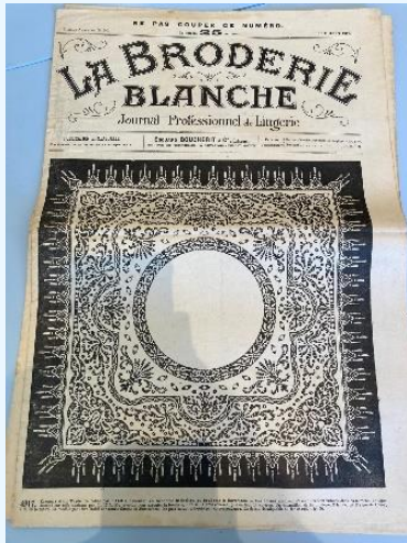
Tijdschrift uit 1917

Eigenlijk is Bibliotheek een verkeerde naam voor de verzameling boeken, tijdschriften en patronen op de 1e verdieping boven de Tesselschade winkel in Amsterdam. Het is een archief met veel bijzondere stukken. Deze verzameling is opgebouwd uit schenkingen van handwerkkliefhebbers.