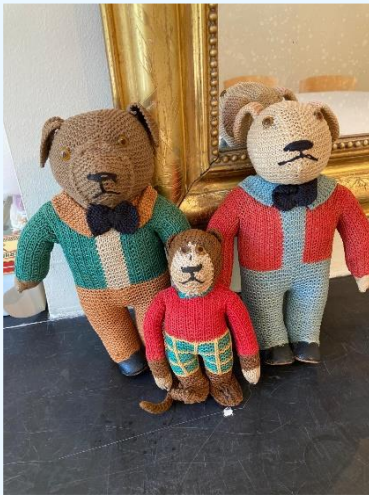
Poppen uit Bruintje Beer verzameling gemaakt voor Arbeid Adelt 1925

Eigenlijk is Bibliotheek een verkeerde naam voor de verzameling boeken, tijdschriften en patronen op de 1e verdieping boven de Tesselschade winkel in Amsterdam. Het is een archief met veel bijzondere stukken. Deze verzameling is opgebouwd uit schenkingen van handwerkkliefhebbers.