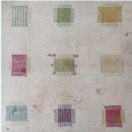
Stoplap uit 1739.

Natuurlijk zal het ook zijn voorgekomen dat een dochter van haar moeder leerde stoppen. Beheerste de huisvrouw de kunst van het stoppen niet dan werd het werk uitbesteed aan een stopster, of linnen- of huisnaaister.