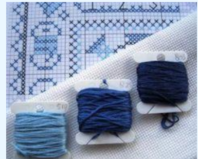
Borduren in Oud Hollandse motieven