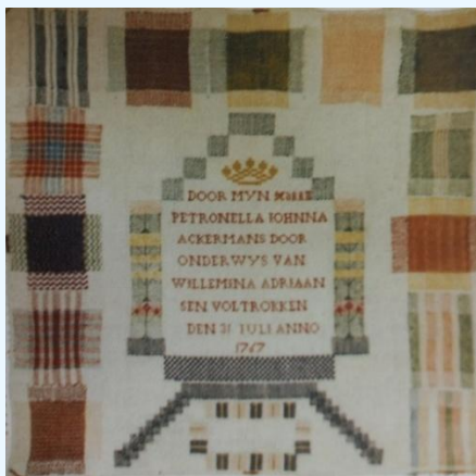
Stoplap uit 1767 uit "Door mijn gedaan".

Om fraai te kunnen stoppen is kennis nodig van weefbindingen en breisteken. Maar waarom zou je iets stoppen zult u zich afvragen. Vandaag de dag kunnen wij ons niet goed meer voorstellen wat dat is iets stoppen of verstellen. Vroeger was het de normaalste zaak van de wereld en het was een ware kunst om dit zo onzichtbaar mogelijk te doen. Immers kleding en ander textiel waren kostbaar! De eenvoudigste manier om iets op te lappen was om er gewoon een lap op te naaien. Maar dat was natuurlijk niet mooi. Bovendien gaf dat al gauw de verdenking dat een huisvrouw de kunst van het stoppen niet beheerste. Je zou het als een uitdaging kunnen zien iets zo mooi mogelijk te herstellen. Het vraagt veel geduld en oefening.