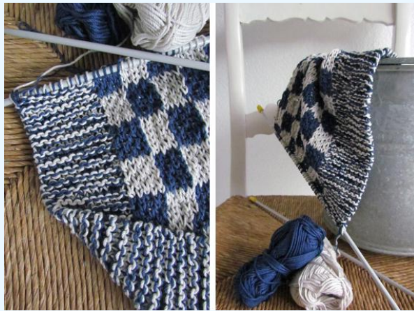
Breien met "de Handwerkjuf"