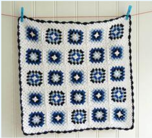
Haken in Delfts Blauw